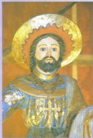
Apóstol Santiago, S. XVII

La ejemplar y solidaria Ofrenda - Romería a Santiago el Peregrino, organizada por la Comunidad Escolar, es el anuncio de la fiesta de nuestra identidad canaria y nos lleva a preparar las Fiestas Mayores en honor de Santiago Apóstol.