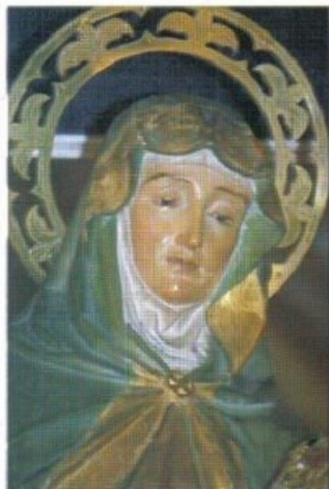
Santa Ana S. XX