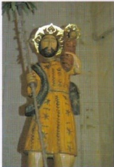
San Cristóbal S. XX